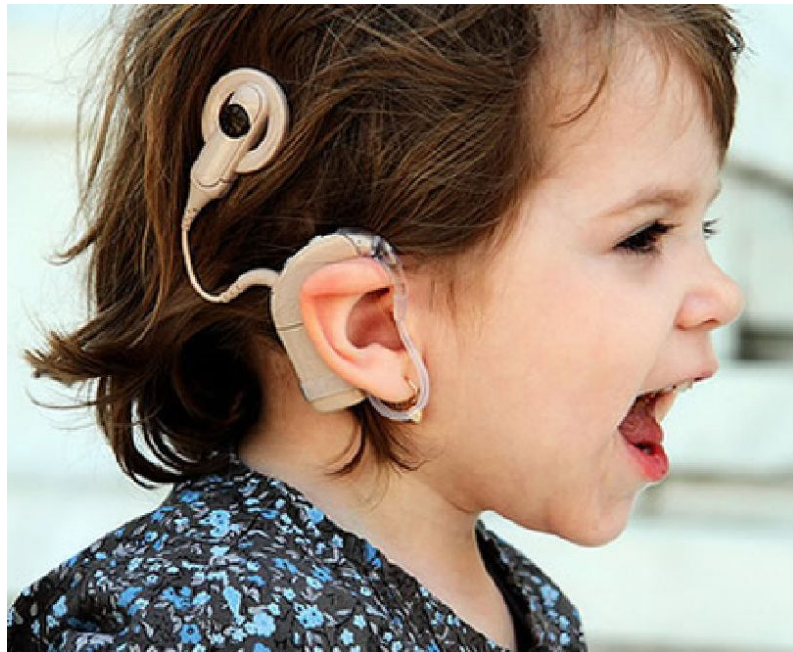
Figura 5: Implante Coclear.

Não passando no primeiro teste é marcado o retorno para ser realizado o reteste, se no caso não ser positivo, o bebe será encaminhado para um otorrinolaringologia, sendo realizado vários outros exames para ter a certeza se a criança ouve ou possui deficiência auditiva. Posteriormente se todos os exames confirmarem a falta de audição, juntamente com a família será consultado a possibilidade de ser realizado um implante coclear, prótese auditiva e também a introdução de terapia fonoaudiológica.